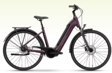
WINORA Tria N5 75 Nm, 625 Wh Akku 3.399.- €