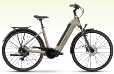
WINORA Tria X9 75 Nm, 500 Wh Akku 2.999.- €