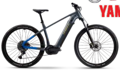
HAIBIKE Alltrack 6,5 85 Nm, 600 Wh Akku statt 3.599.- € 2.999.- €