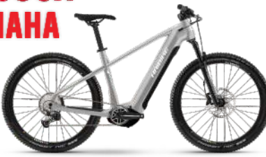
HAIBIKE Alltrack 7 85 Nm, 720 Wh Akku statt 3.999.- € 3.399.- €