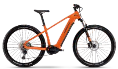
HAIBIKE Alltrack 6 75 Nm, 720 Wh Akku statt 3.499.- € 2.699.- €