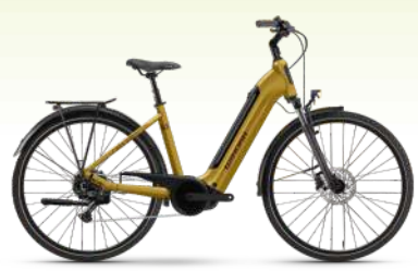
WINORA Tria X11 75 Nm, 625 Wh Akku 3.299.- €