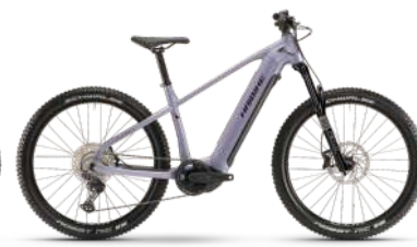
HAIBIKE Alltrack 7 85 Nm, 720 Wh Akku statt 3.999.- € 3.399.- €