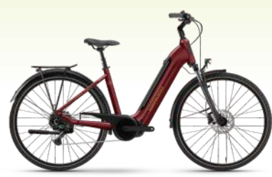
WINORA Tria X11 75 Nm, 625 Wh Akku 3.299.- €