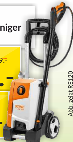
Abb. zeigt RE120