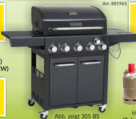
Abb. zeigt 305 BS