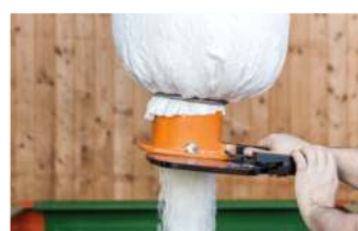
FLEDBAG öffnen - fertig