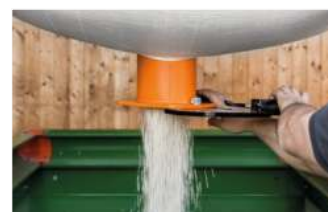
FLEDBAG etwas herausziehen, öffnen - fertig