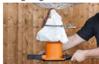
Spannring über Auslass schieben