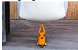
Big-Bag positionieren & ablassen