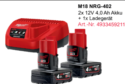
M18 NRG-402 2x 12V 4,0 Ah Akku + 1x Ladegerät Art.-Nr. 4933459211