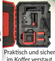
Praktisch und sicher im Koffer verstaut