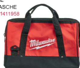
MILWAUKEE ARBEITSTASCHE Art.-Nr. 4931411958