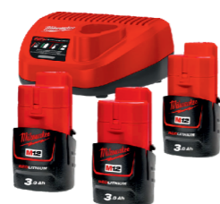
M12 NRG-303 3x 12V 3,0 Ah Akku + 1x Ladegerät Art.-Nr. 4933459207